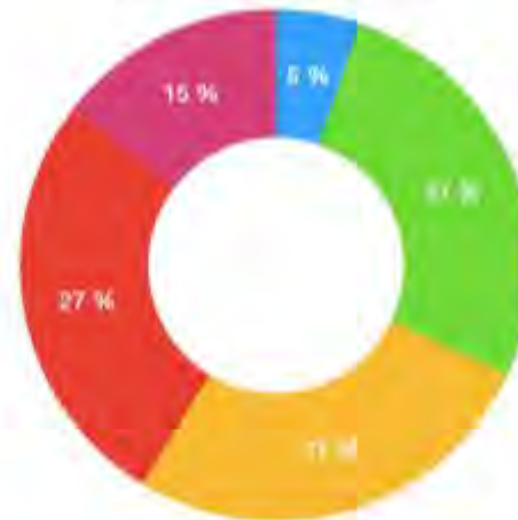
REPARTITION DES DEPENSES